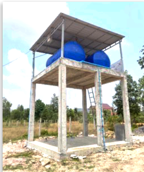
Wassertanks, in denen wir Filter installieren werden