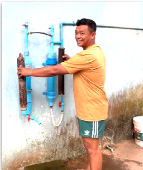
Die alten und neu installierten Filter.

Ebenfalls wurden wir angefragt, in Sri Lanka Wasserfilter zu installieren. Wenn alles klappt, machen wir im August einen kurzen Einsatz in Sri Lanka :-).