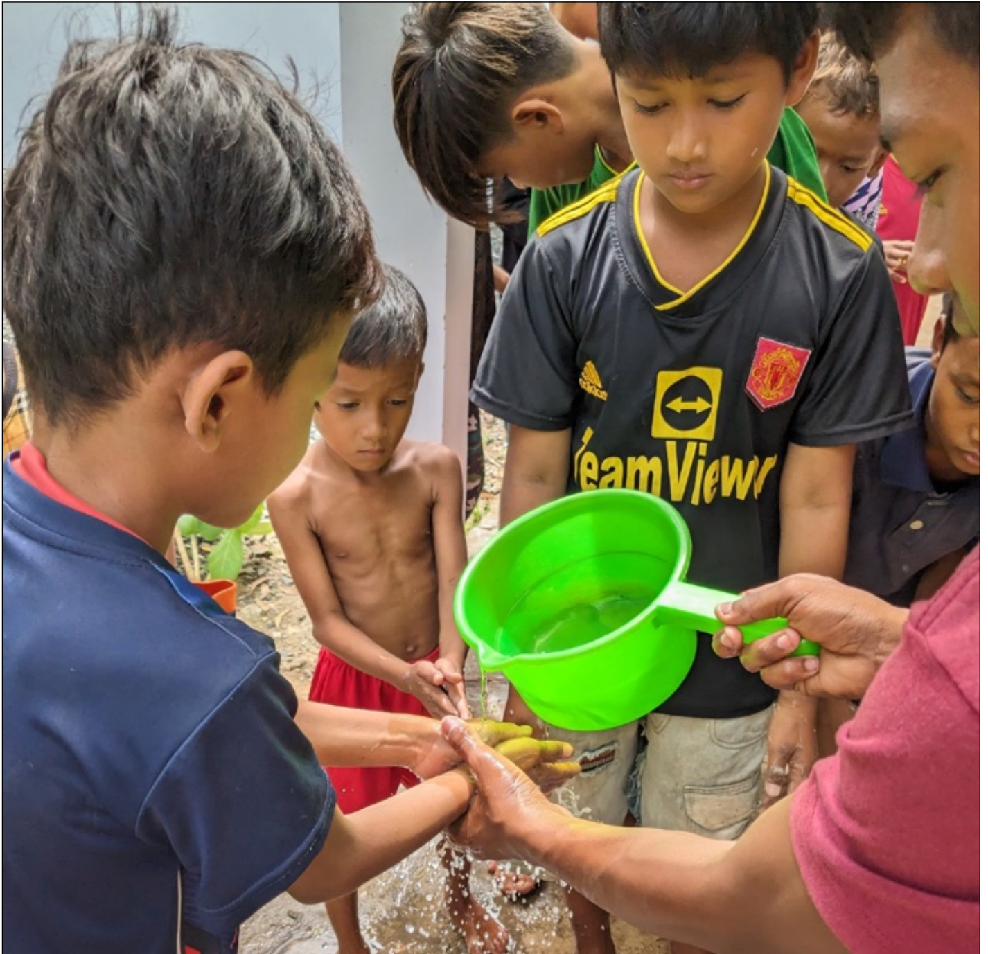
Hygieneschulungen mit Kindern in Kambodscha.

Warm Blankets engagiert sich durch deine Unterstützung in Entwicklungsländern, damit bedürftigen Kindern ein menschenwürdiges Leben, ein sicheres Zuhause, gesundes Essen, sauberes Trinkwasser und eine Ausbildung ermöglicht werden.