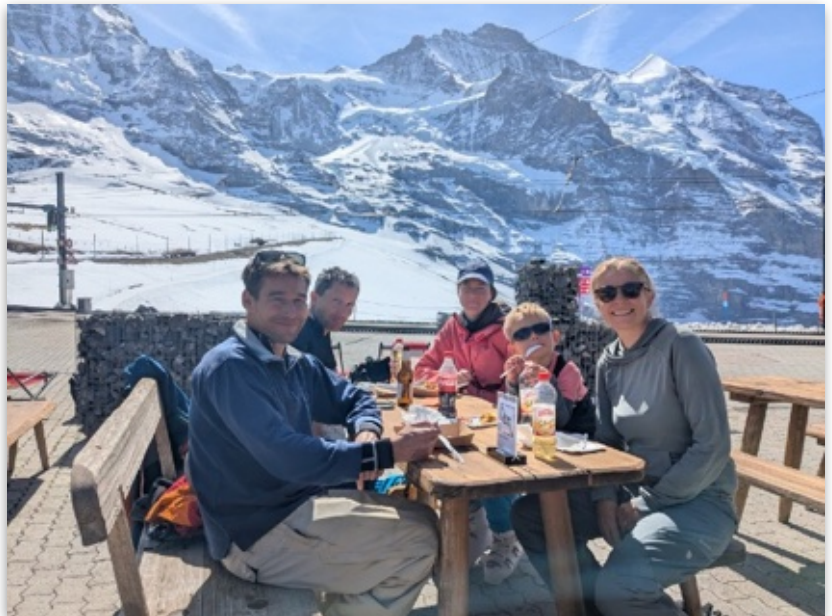
Zeit mit Freunden geniessen.

Im April machten wir einen einmonatigen Besuch in der Schweiz. Es war eine intensive Zeit und wir haben sie genutzt, Freunde, Familie und Bekannte wiederzusehen. Wir konnten auch diverse administrative Arbeiten für Warm Blankets erledigen und einen neuen Vorstand einberufen. Es war eine sehr schöne Zeit für uns. Wir merkten, dass unsere Arbeit in Kambodscha geschätzt und gewürdigt wird. Wir sind sehr ermutigt und erfrischt, wieder nach Kambodscha, unserer jetzigen Heimat, zurückgekehrt.